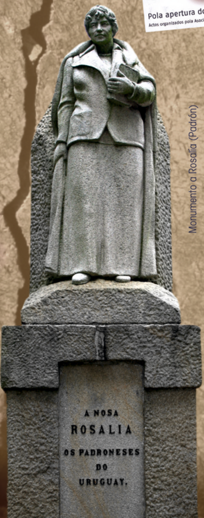
Monumento a Rosalía (Padrón)