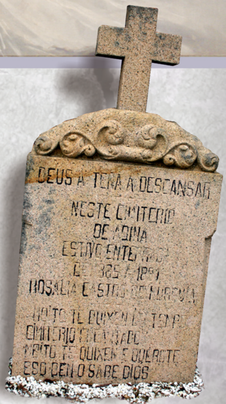
Lápida de Rosalía no cemiterio de Adina (Padrón).